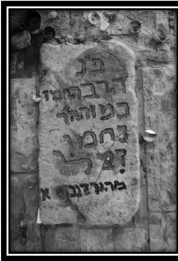
ציון רבי נחמן מהורדנקה זצוק"ל

יום רביעי [ל' סיון] הילולת הגאון רבי שלמה קלוגר זיע"א. יום המישי [א' תמוז] הילולת הצדיק בעל ה'מאור ושמש' זיע"א. יום שישי [ב' תמוז] הילולת הצדיק רבי נחמן מהורדנקה זיע"א.