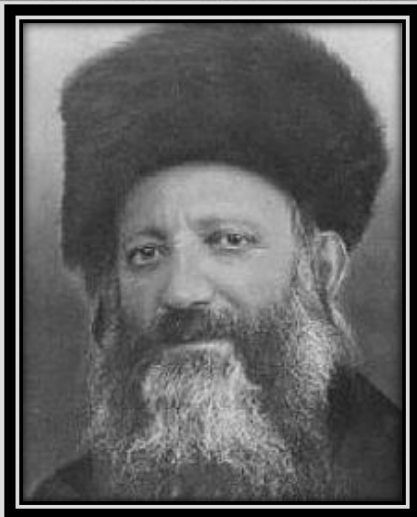
יום שלישי - ג' אלול הילולת הראי"ה קוק זצוק"ל זיע"א

עלון שבועי להפצת אור תורתם של הצדיקים האמתיים שוכני עפר, קדושים אשר בארץ המה, והתקשרות בנשמתם הטהורה